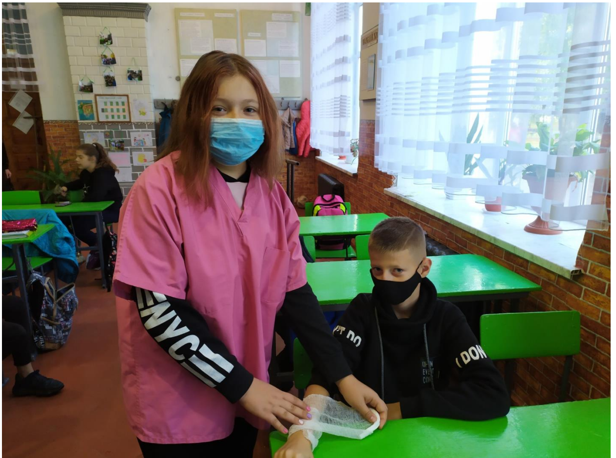
Тематична бесіда «Надання першої медичної долікарської допомоги» у 6-А класі