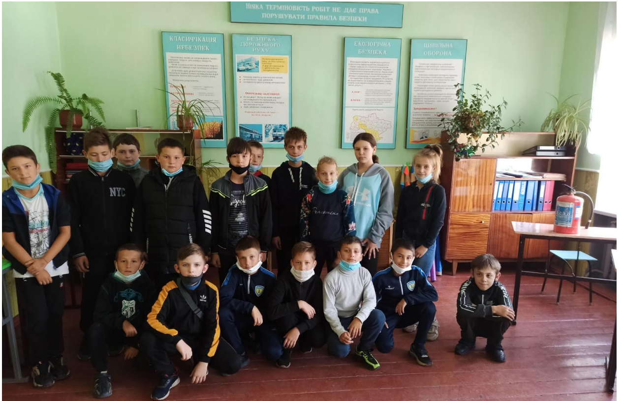
Тематична бесіда «Правила поведіння у разі виникнення підозрілих вибухонебезпечних предметів» у 6-Б класі