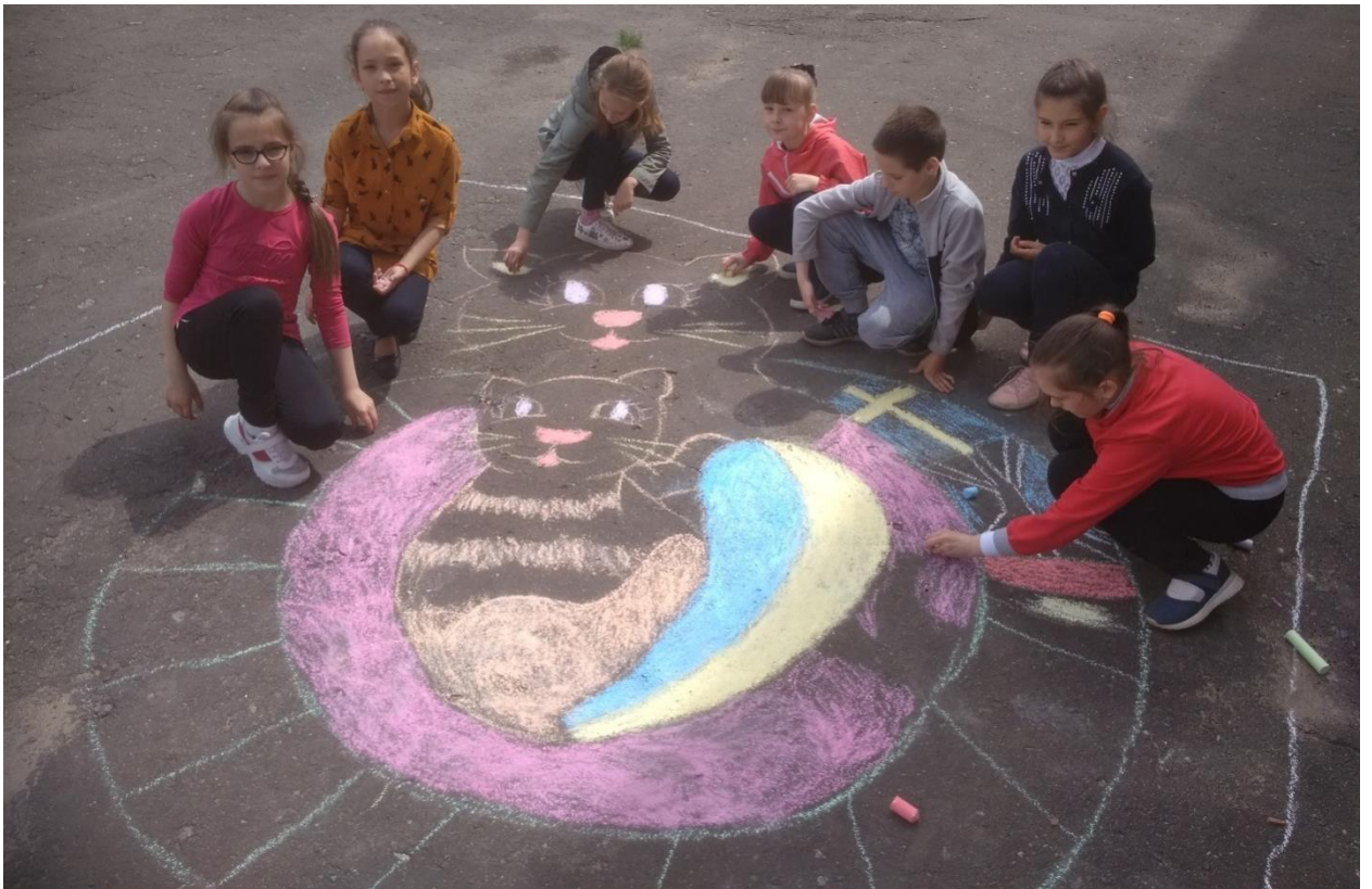
Конкурс малюнку на асфальті «Безпека в житті-життя в безпеці»