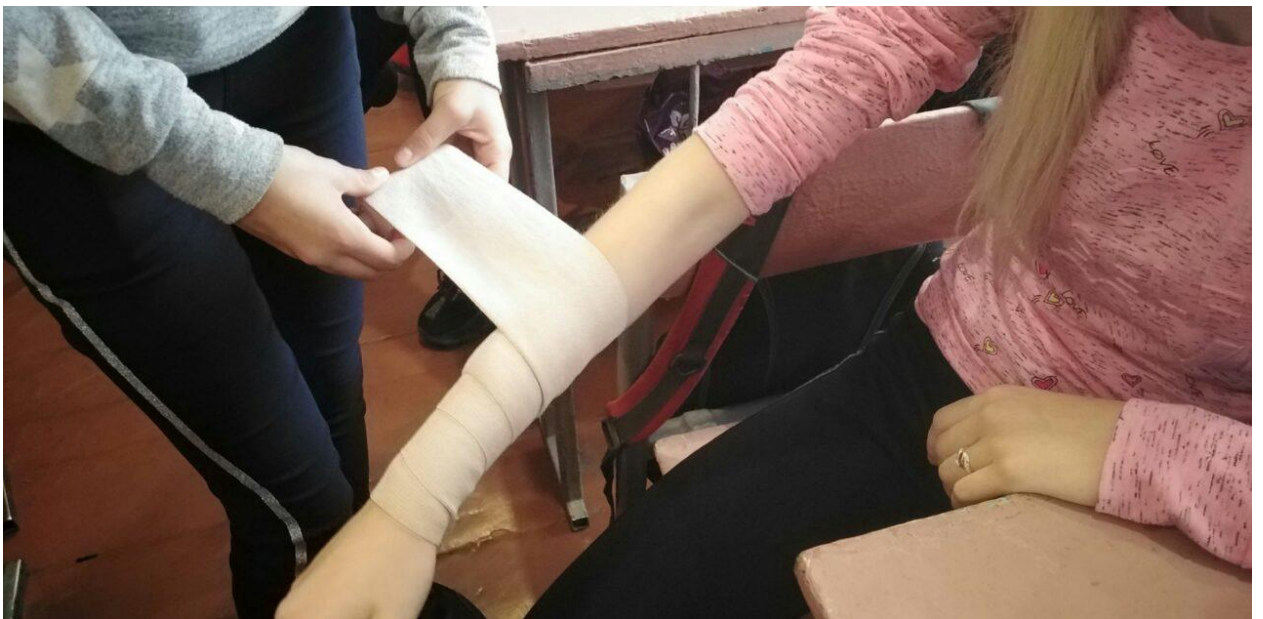
Проведення навчання з учнями 9-А класу з питань використання засобів індивідуального захисту та надання першої медичної долікарської допомоги