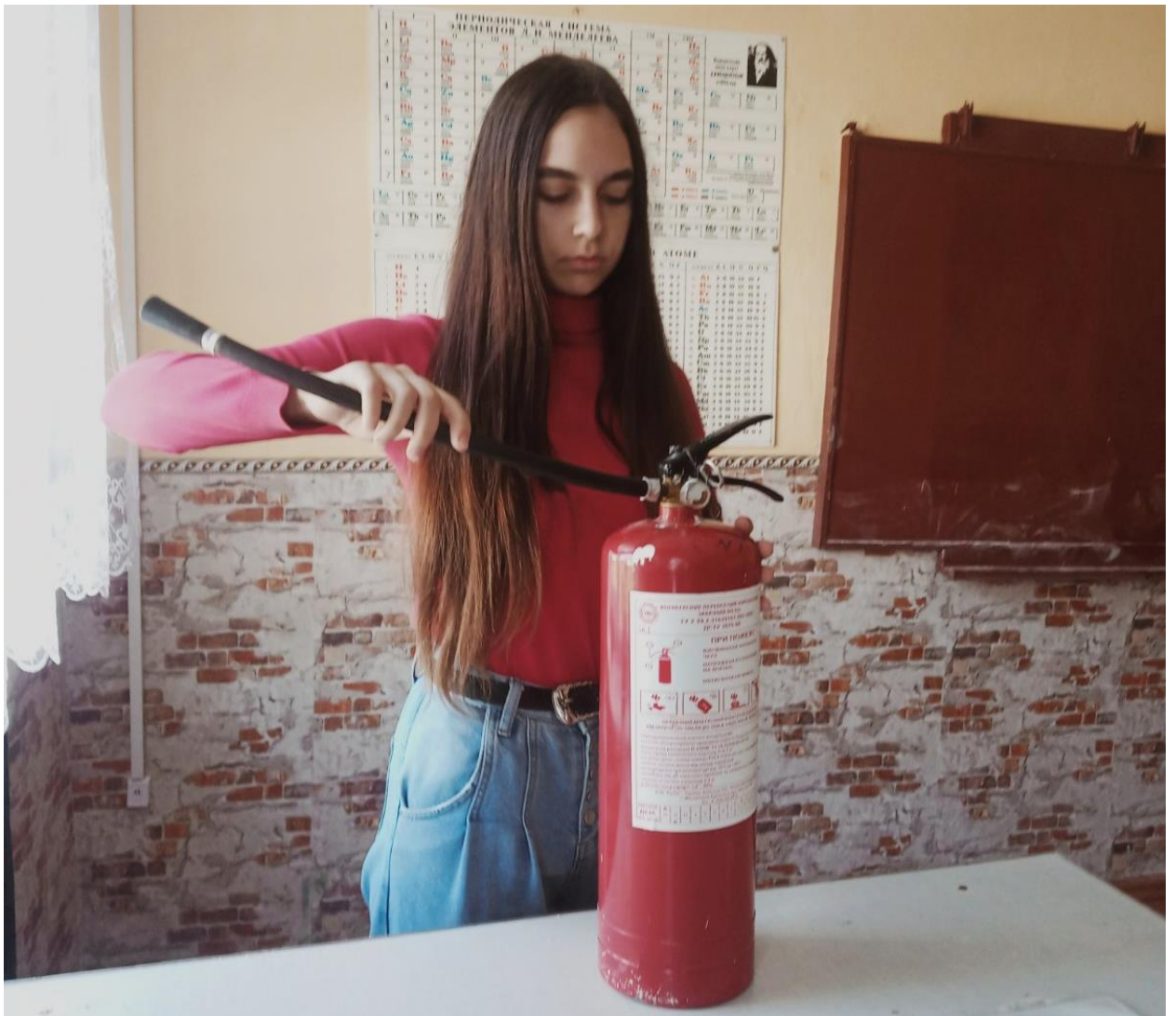
Тематична бесіда у 9-Б класі «Дії при пожежі»