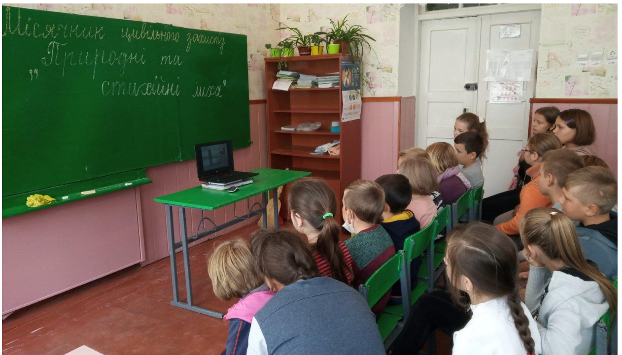
Тематична бесіда з переглядом відеоматеріалів «Природні та стихійні лиха»