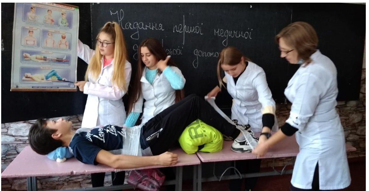
Проведення навчання з надання першої медичної долікарської допомоги