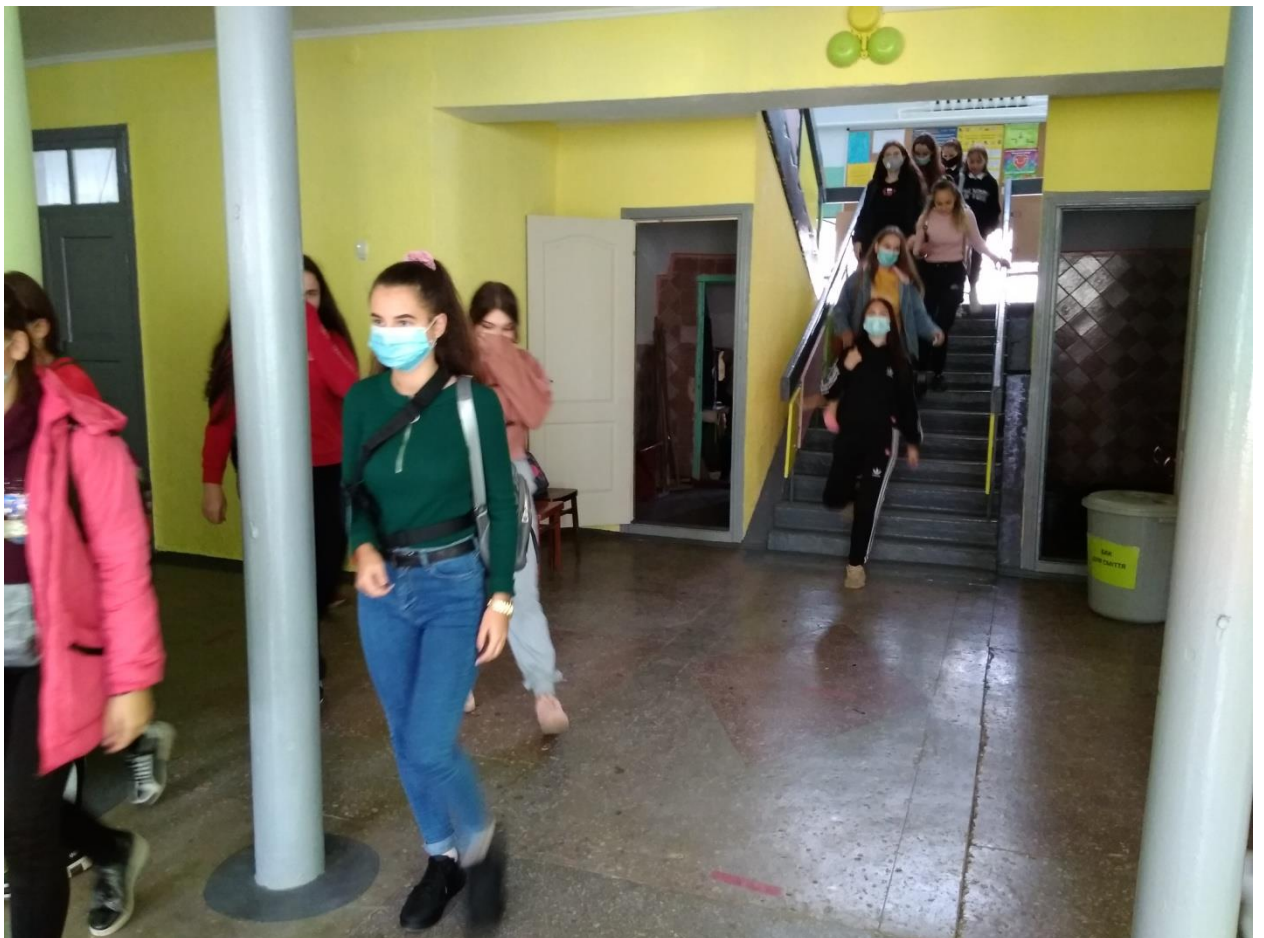
Відпрацювання проведення евакуації учнів