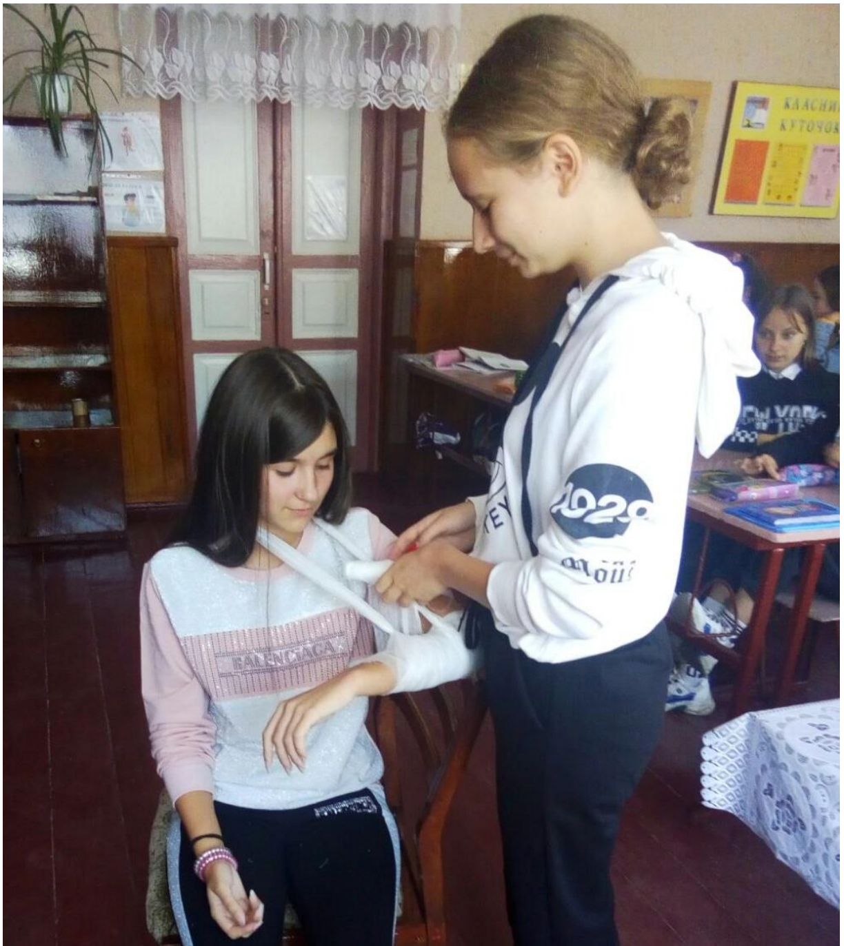
Проведення навчання з учнями 10 класу з питань використання засобів індивідуального захисту та надання першої медичної долікарської допомоги