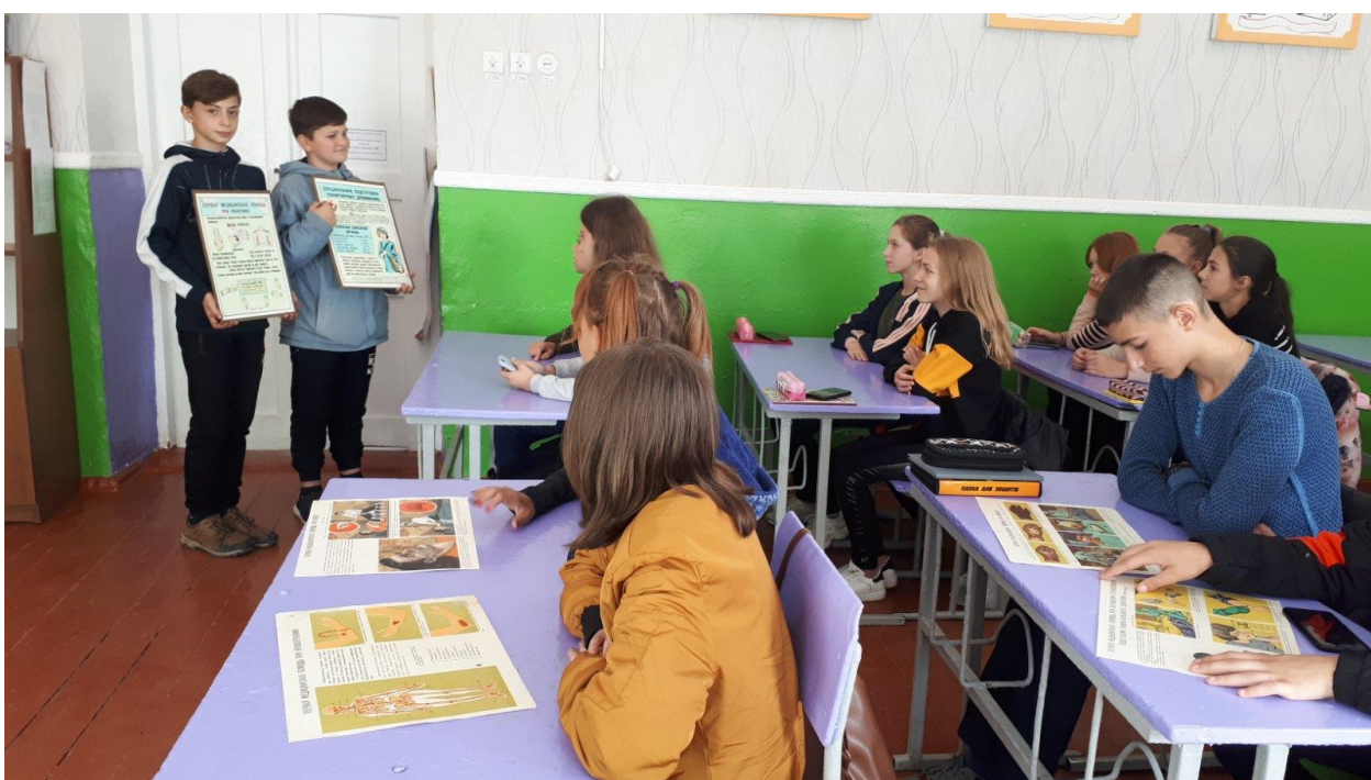
Перегляд матеріалів з безпеки життєдіяльності на тему «Знати, вміти, діяти у надзвичайних ситуаціях» у 8-Б класі