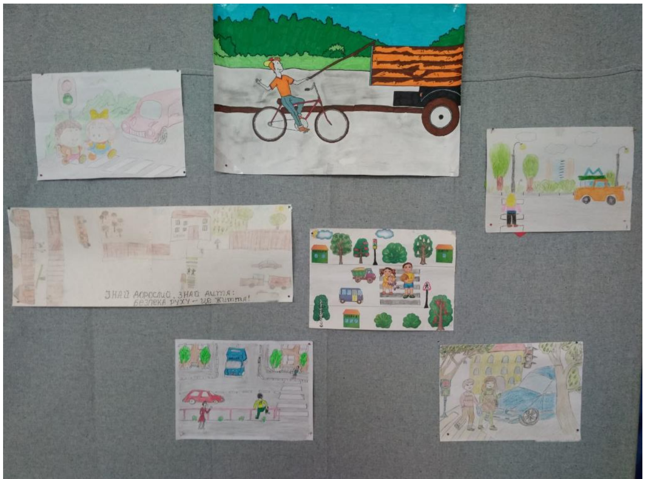
Конкурс малюнків «Я малюю безпеку»